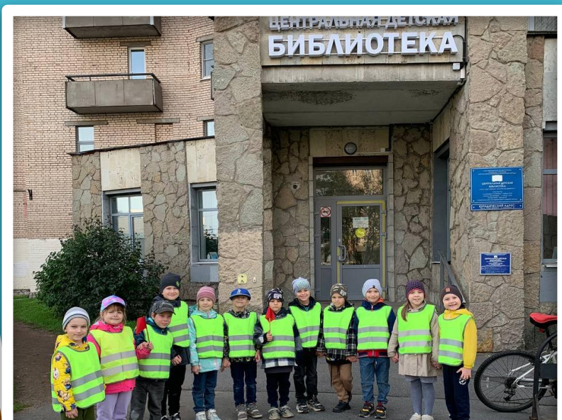
Центральная детская библиотека Невского района