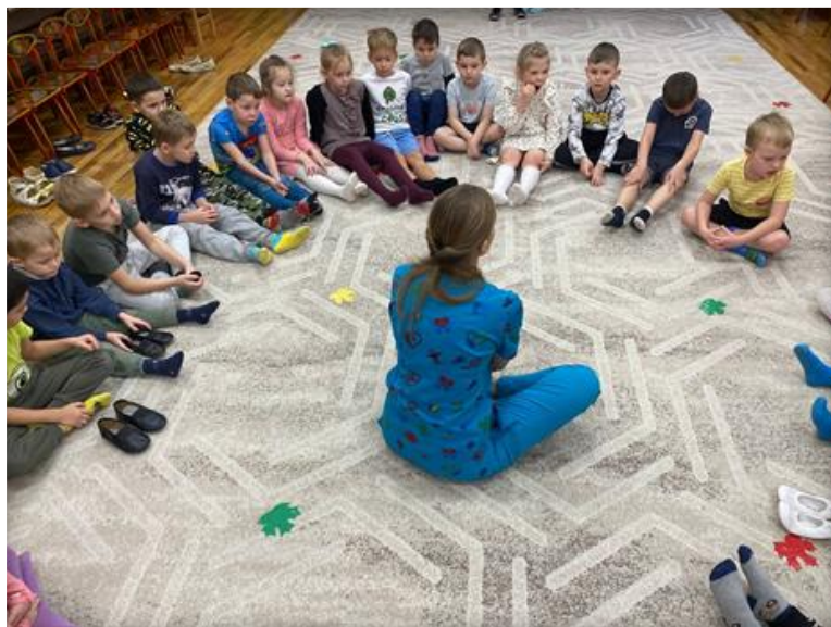
Гость группы – медицинская сестра по массажу