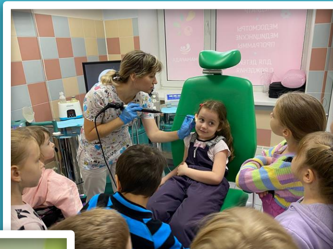
Кабинет ЛОР врача