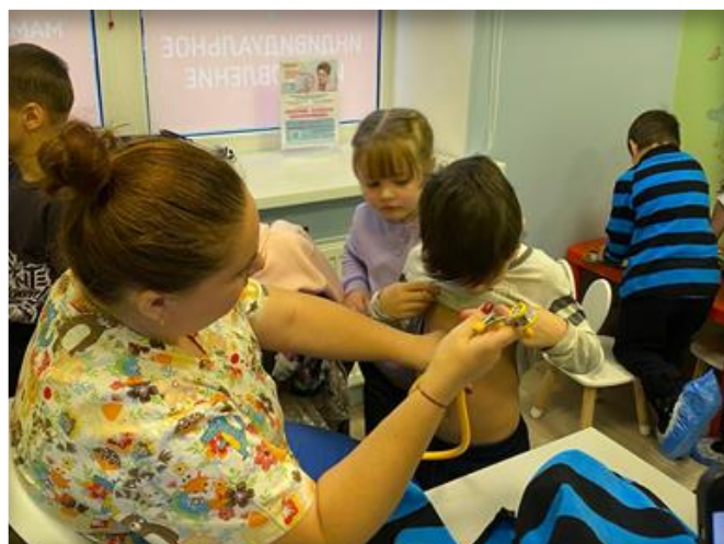
Экскурсия в медицинский центр «Мама рада»