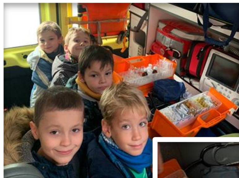
Экскурсия в машину скорой помощи