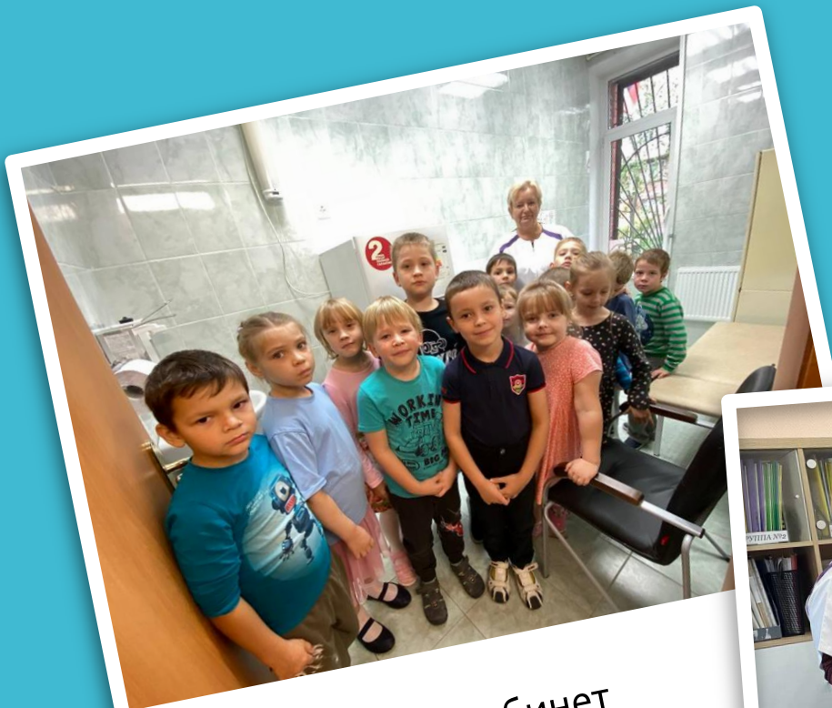
Экскурсия в кабинет медицинской сестры